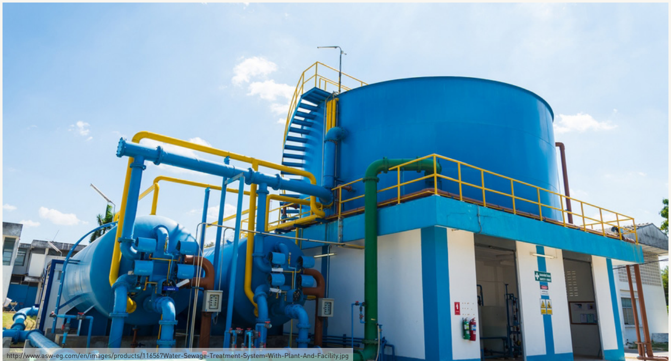
Endüstriyel Atıksu Arıtma Tesisi

Entegre atıksu yönetimi stratejilerinin uygulanmasıyla su tüketiminde, atıksu miktarında ve atıksuların kirlilik yüklerinde ortalama %25'e varan azalma sağlanabilmektedir. Uygulamanın potansiyel geri ödeme süresi 1-10 yıl arasında değişmektedir (TOB, 2021).