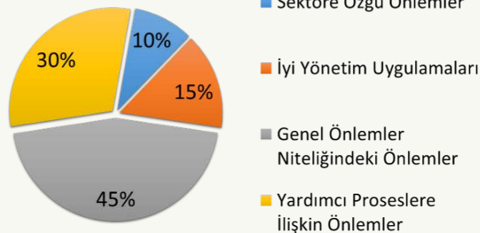
Su Verimliliği Uygulamalarının Yüzdelerle Dağılımı