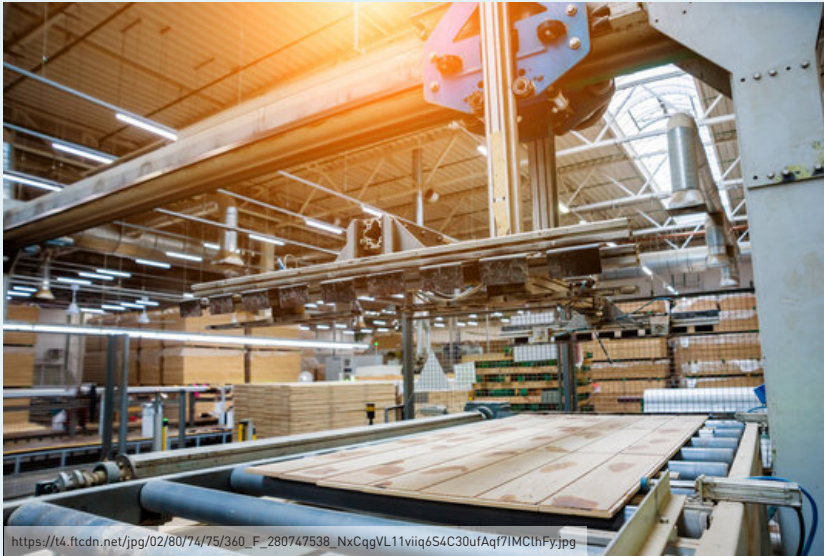
Ahşap Kaplama Panel ve Parke Üretim Tesisi

Talaşların yumuşatılıp buharla pişirildiği aşama ile rafineri arasında talaşlardan vidalı tapa (screw plug) ile alınan su, rafine etme sırasında rafineri diskine eklemek için kullanılabilir. Ayrıca kalan konsantre su hat içinde, örneğin buharlaştırma, yüzdürme veya çözünmüş hava ile yüzdürme yoluyla arıtılabilir. Bu teknik ile su kullanımının ve atıksu oluşumunun azaltılması mümkündür (IPPC BREF, 2016).