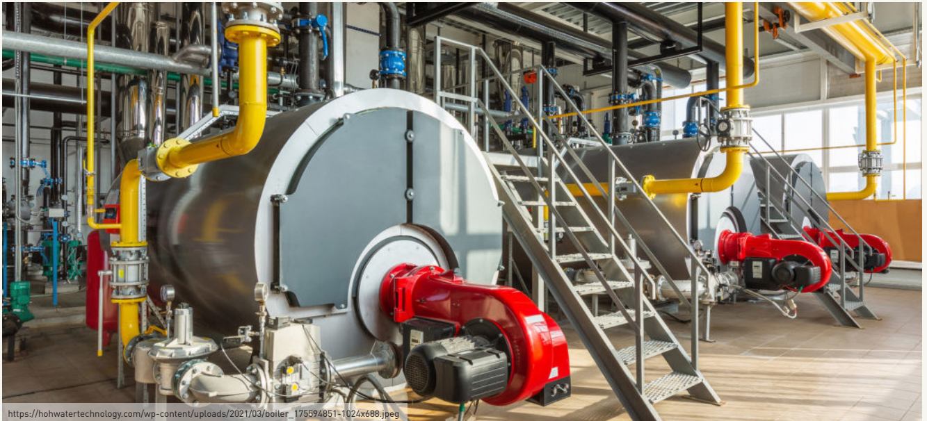
Endüstriyel Buhar Kazanları

Üretim proseslerinde kayıpların önlenmesi amacıyla; pompalar, valfler, ayar düğmeleri, basınç, akış regülatörleri gibi ekipmanların en önemli parçalarının bakım kontrol listesine eklenmesi, sadece su sistemlerinin değil ayrıca ısıtma ve kimyasal dağıtma sistemlerinin, tambur, pompa ve valflerin denetimlerinin yapılması, filtrelerin ve boru hatlarının düzenli olarak temizlenmesi, ölçüm ekipmanlarının (termometreler, kimyasal tartıları, dağıtım/dozajlama sistemleri vb.) düzenli kalibrasyonun yapılması ve ısıtma ünitelerinin (bacalar dahil olmak üzere) rutin olarak belirlenen periyotlarda denetlenmesi ve temizlenmesi, etkin bakım-onarım, temizlik ve kayıp kontrolü uygulamaları ile su tüketiminde %1-6 oranında tasarruf sağlanabilmektedir (Hasanbeigi, 2010; Öztürk, 2014; TOB, 2021).