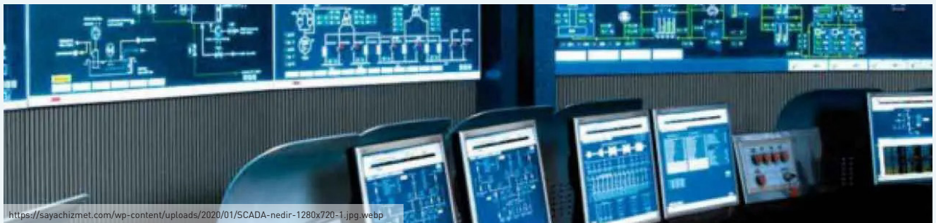
Bilgisayar Destekli Kontrol Sistemi

Endüstriyel tesislerde durulama atıksuları nispeten temiz karakterdeki atıksular, yüksek su kalitesi gerektirmeyen zemin yıkama ve bahçe sulama işlemlerinde arıtılmadan tekrar kullanılabilir (Öztürk, 2014). Durulama sularının geri kazanımıyla ham su tüketiminde %1-5 arasında tasarruf sağlanabilmektedir.